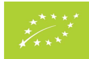
Pantone 376 | C050; M000; Y100; K000

1) Standartinė Pantone sistemos spalva – žalia Pantone Nr. 376, o naudojant keturių spalvų procesą – žalia (50 proc. žalsvai mėlyna + 100 proc. geltona)