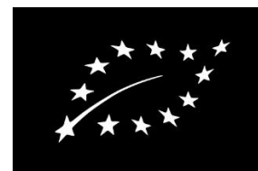
Leidžiamas juodai baltas

3) Jeigu pakuotės arba etiketės fono spalva yra tamsi, gali būti naudojamas logotipo negatyvinis atvaizdas, kuris sukuriamas panaudojant pakuotės ar etiketės fono spalvą.